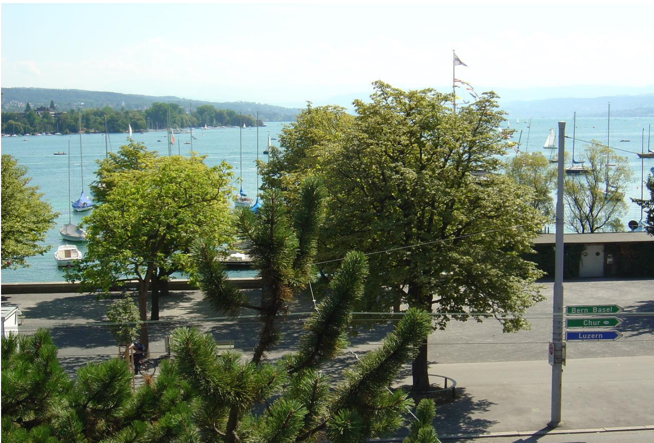
3) Aussicht über den Zürichsee