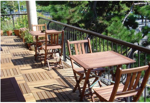
1) Gemütlicher Sonnen-Balkon